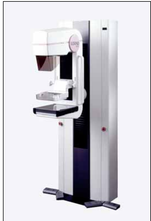
マンモグラフィ装置(日立メディコ) LORAD M - 4

最先端技術の採用により、従来の装置に比べ飛躍的に画質が向上し、非常に少ない被曝線量で鮮明な画像が得られ、乳がんの発見に威力を発揮します。